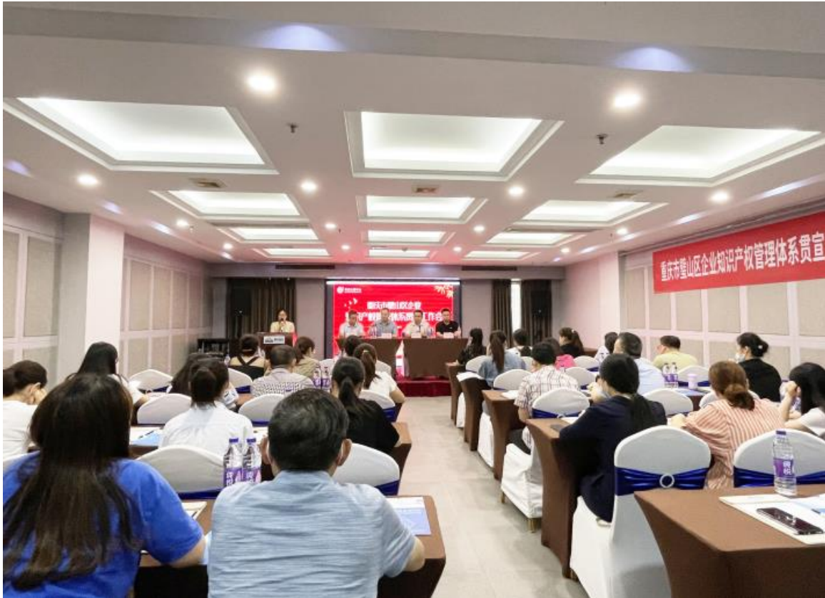
2022 年 6 月重庆璧山区知识产权贯标启动会

2022 年 6 月 8 日参加重庆璧山区知识产权贯标启动。会议针对知识产权贯标宣传为重点实施，会议主要分析了认证的有效性和价值，引导企业树立正确的认知，帮助企业做好相关工作。