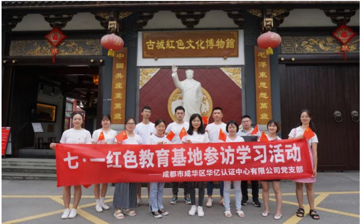
2022年7月红色教育基地参访学习活动